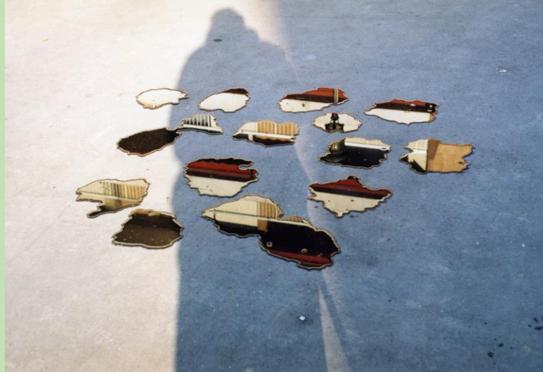
Simon Quéheillard , Quatorze flaques sur ma table Photographie, 2005