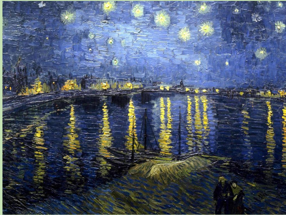
Vincent Van Gogh, La Nuit étoilée sur le Rhône, 1888, Paris