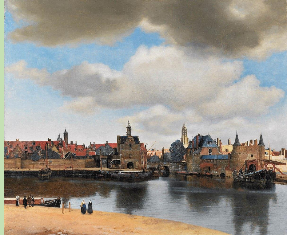
Johannes Vermeer, Vue de Delft, 1659-1660, Mauritshuis, La Haye