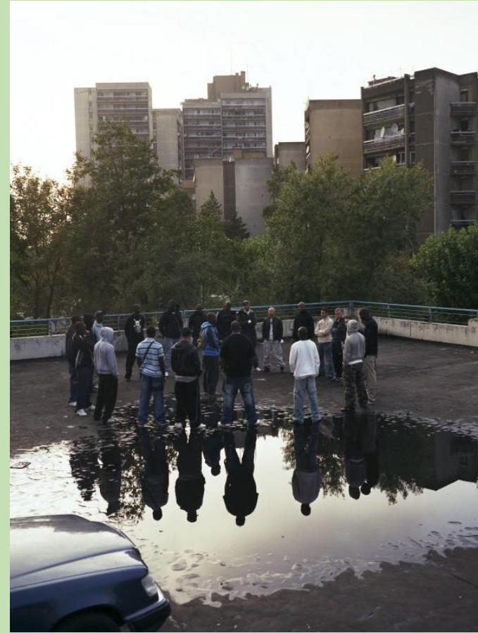
Mohammed Bouroussia Le Miroir, série Périphérique 2006, FRAC Bretagne