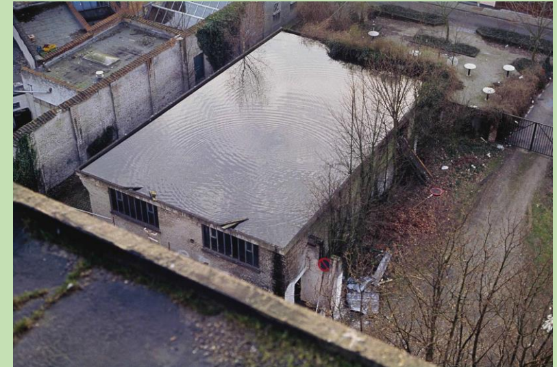
Gabriel Orozco, From Roof to Roof, 1993