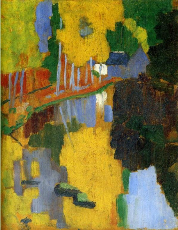
Paul Sérusier, Le Talisman, L'aven au bois d'Amour, huile sur bois, 1888, Paris Au musée de Pont Aven jusqu'en janvier 2019