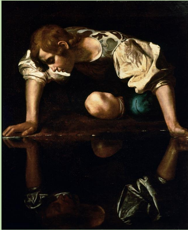
Le Caravage, Narcisse, 1598-1599, huile sur toile, Galerie nationale d'art ancien de Rome