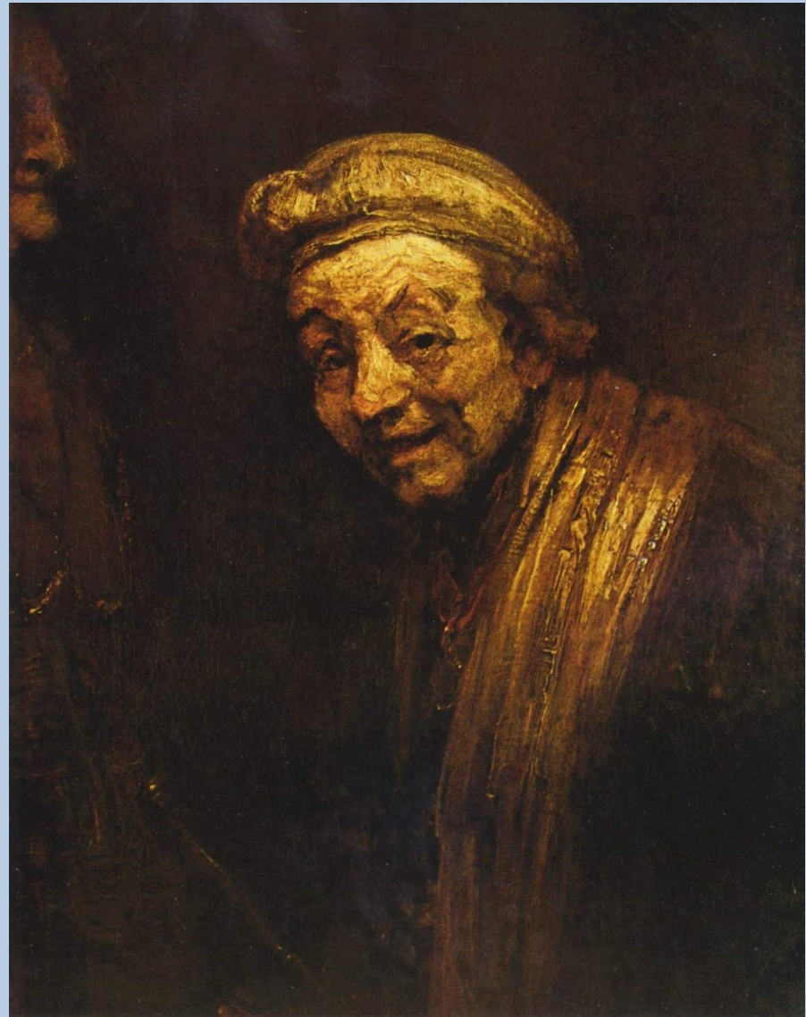
Rembrandt , Autoportrait en Zeuxis, vers 1663, Cologne Zeuxis, peintre grec du Ve siècle av. J.-C. Selon la légende, il est mort de rire en faisant le portrait d'une vieille dame