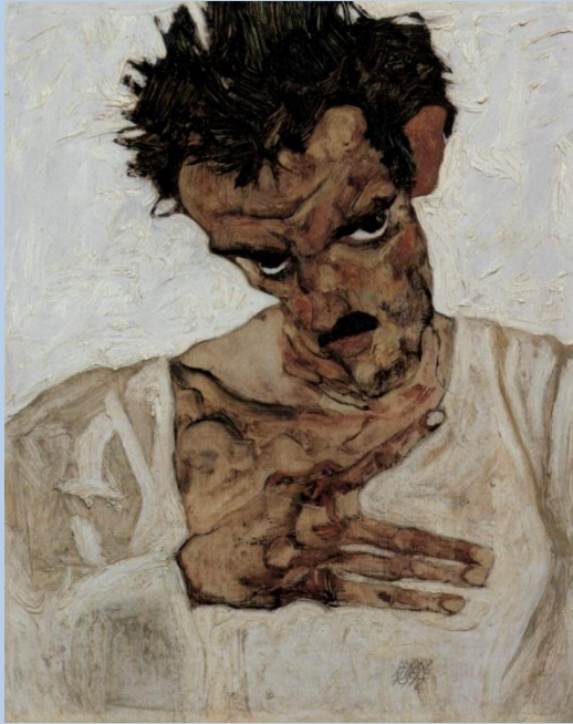
E. Schiele, Autoportrait tête baissée, 1910, Vienne