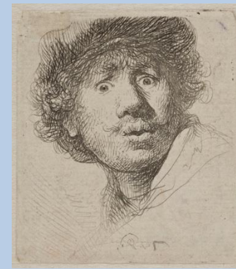
Rembrandt, Autoportrait aux yeux hagards, 1630, Paris