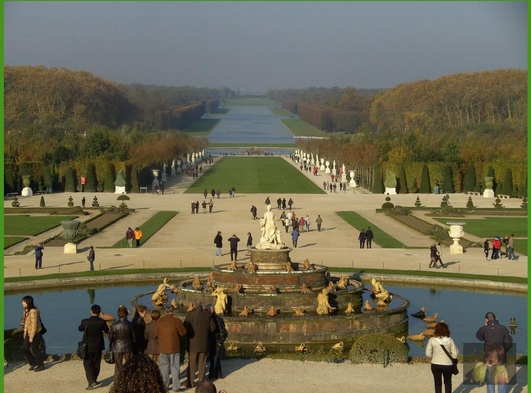
Jardins à Versailles (vue du Grand Canal)

Construire des boîtes noires (cf. Ilan Wolff) et expérimenter ce dispositif pour photographier des jardins