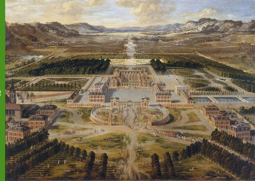
Le Château de Versailles, P. Patel, 1668, Versailles