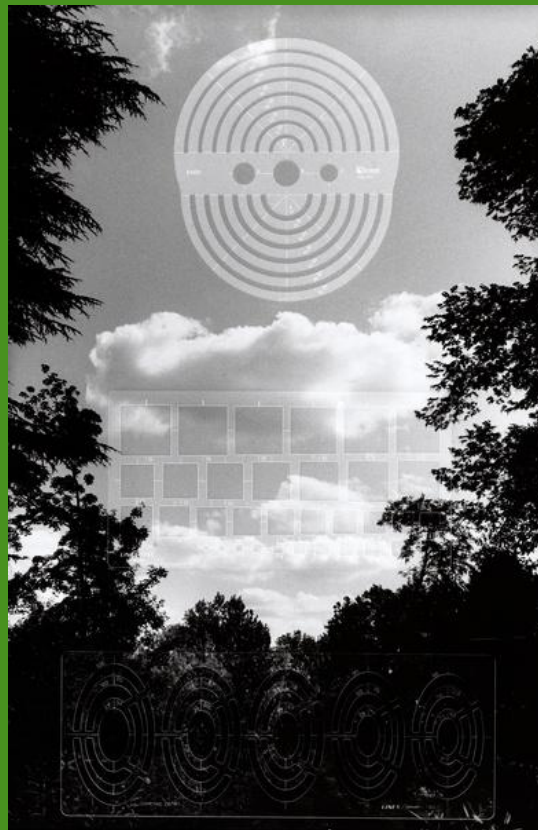
P. Savatier, Jardin à la Française, 1990, Paris