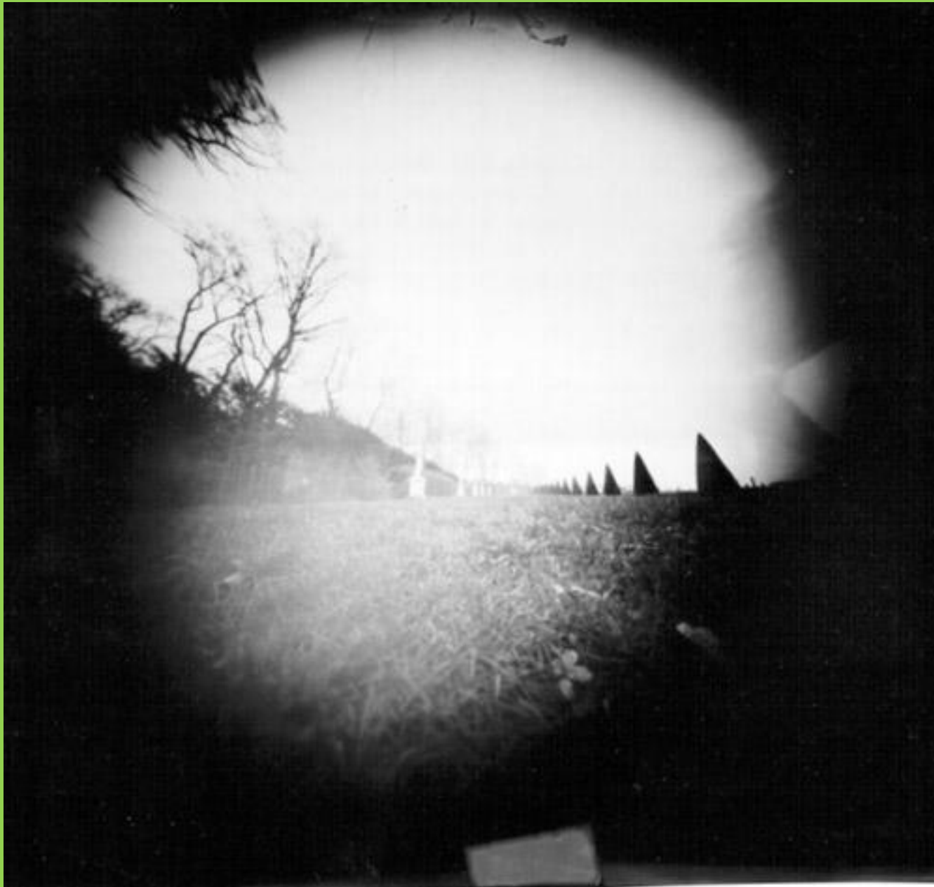
I. Wolff, Versailles – Photographie au sténopé