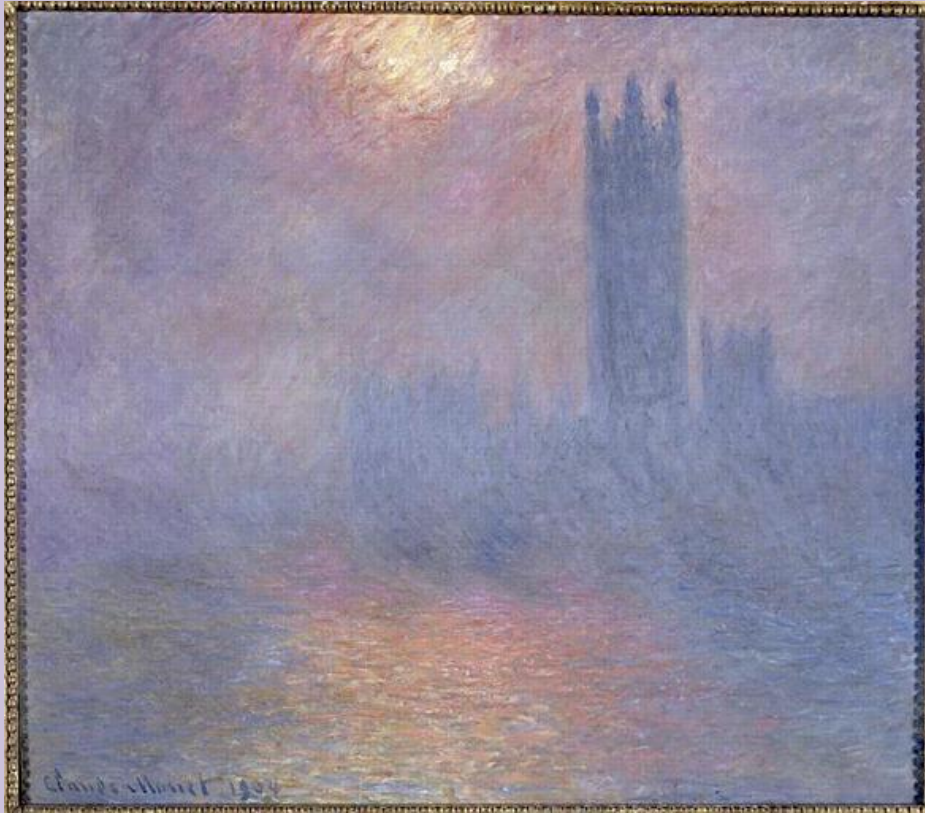
Londres, le Parlement, trouée de soleil dans le brouillard, 1901 - Monet

Fabriquer une grande variété de tons de bleu en mélangeant au bleu primaire (cyan) du blanc ou du noir, et d'autres couleurs / Fabriquer une grande variété de tons de vert en mélangeant du jaune primaire et du bleu cyan