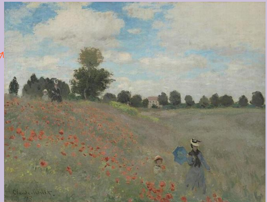
Les coquelicots, 1873 - Monet