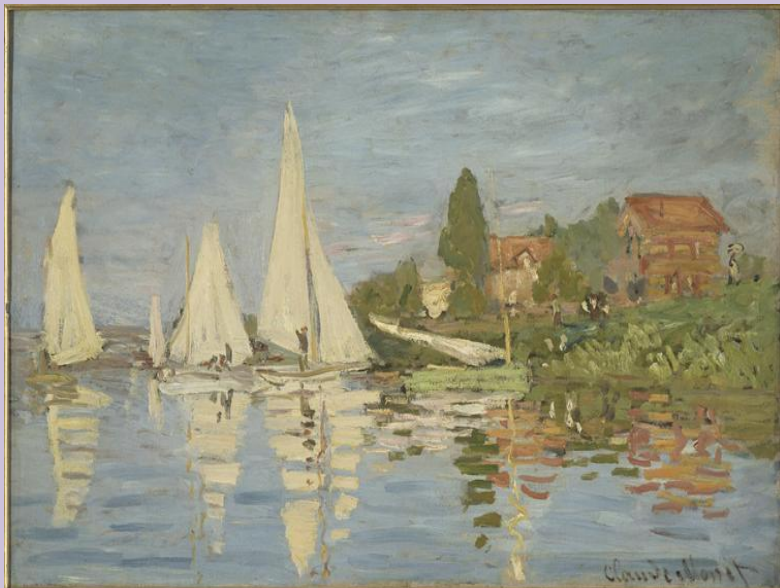
Régates à Argenteuil, 1872 - Monet