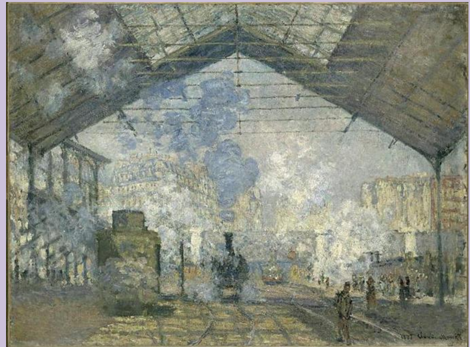
La gare Saint Lazare, 1877 - Monet