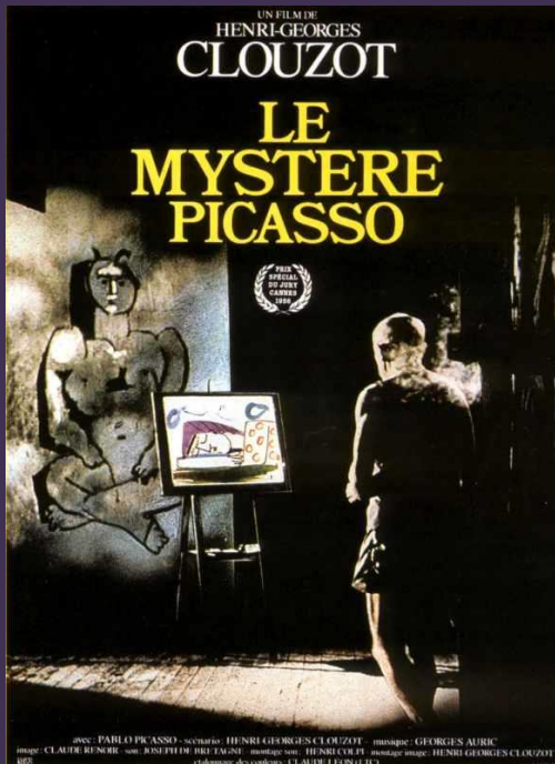
H.G. Clouzot, Le mystère Picasso, 1955