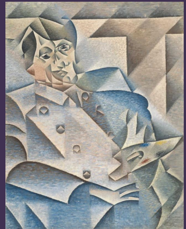
Juan Gris, Portrait de Picasso, 1912, Chicago