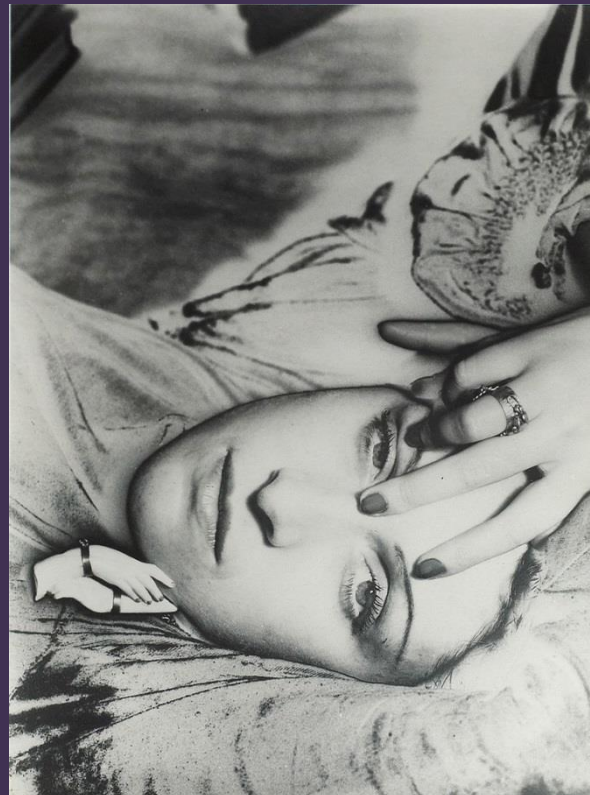
Man Ray, Portrait de Dora Maar, (solarisation), 1936