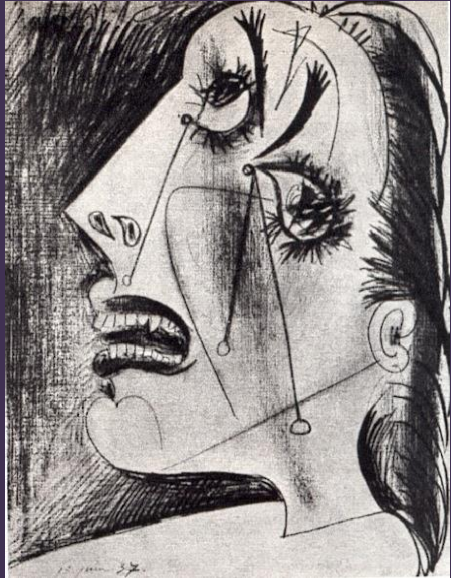
P. Picasso, Femme qui pleure (Portrait de Dora Maar, dessin préparatoire pour Guernica), 1937

Adapter des formes géométriques, en particulier le triangle, pour représenter des personnages