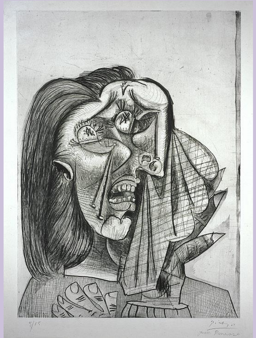
1937, Royal Scottish Academy, Edimbourg