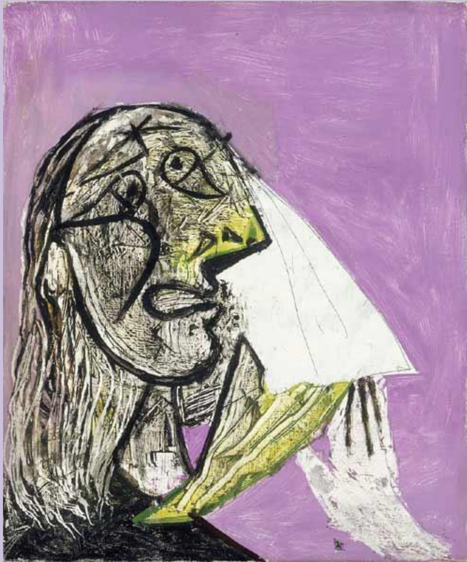
1936, Musée Picasso, Paris