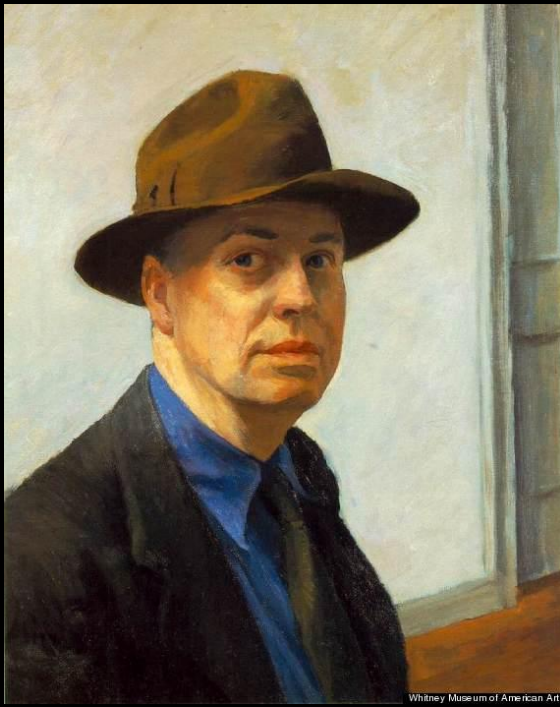
E. Hopper, Autoportrait, v.1930