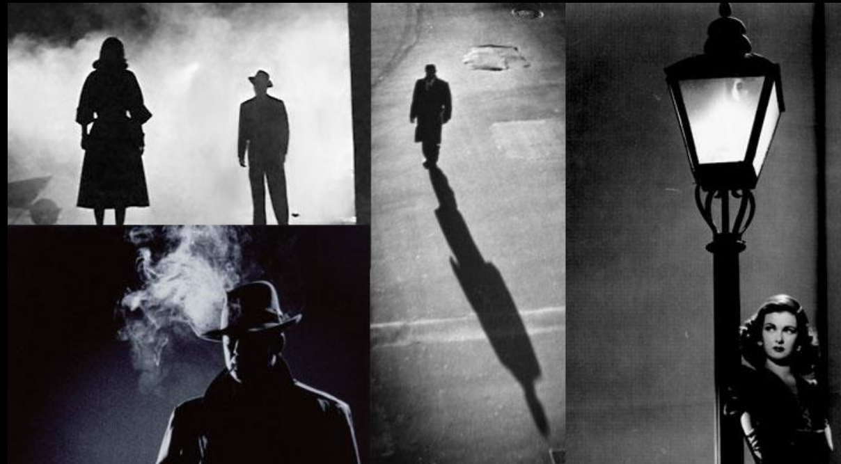
Photogrammes, extraits de films noirs