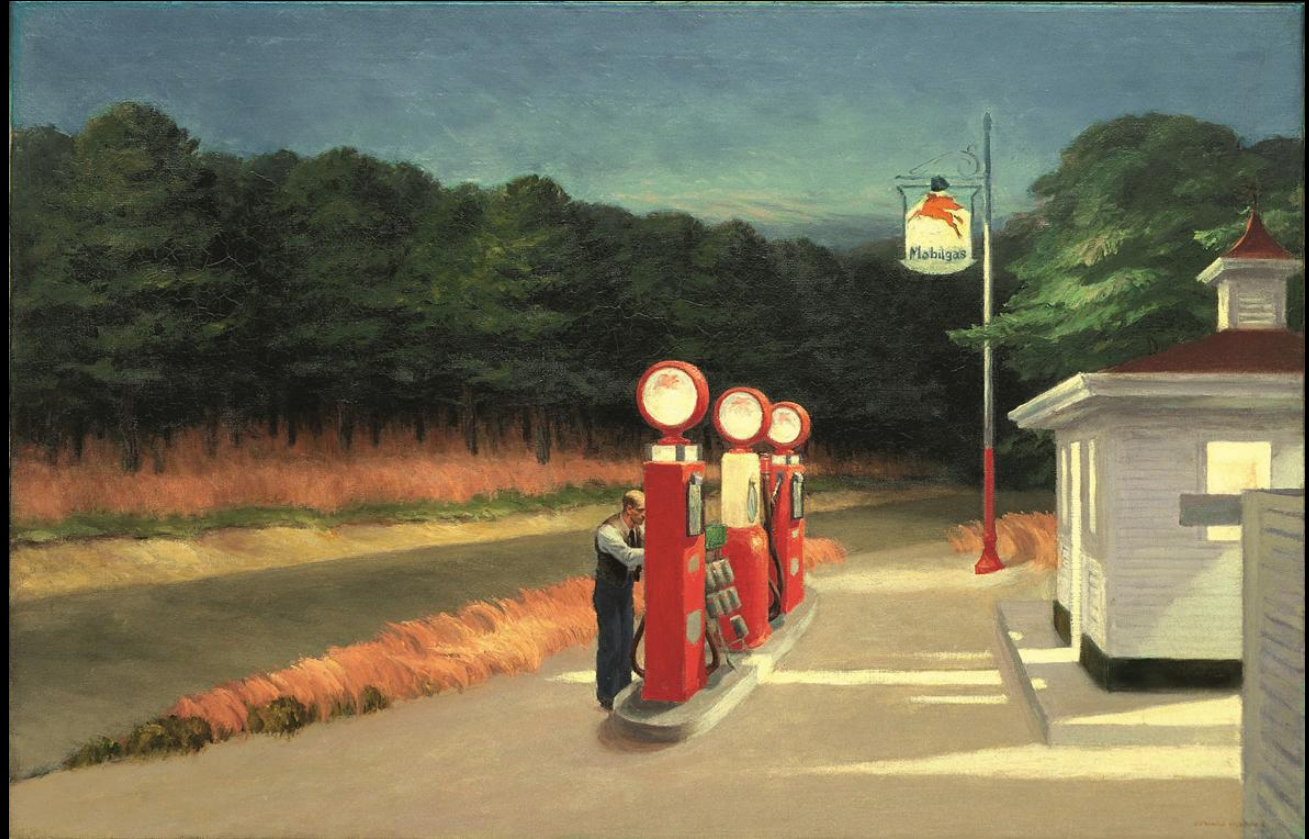
E. Hopper, Gas, 1940, New-York

À partir de l'observation du sujet d'un tableau et l'atmosphère qui s'en dégage, les élèves imagineront les quelques secondes qui précèdent ou qui suivent la scène. L'interprétation respectera les choix du peintre : cadrage, personnage, lumière, ambiance...; elle pourra être jouée et filmée.