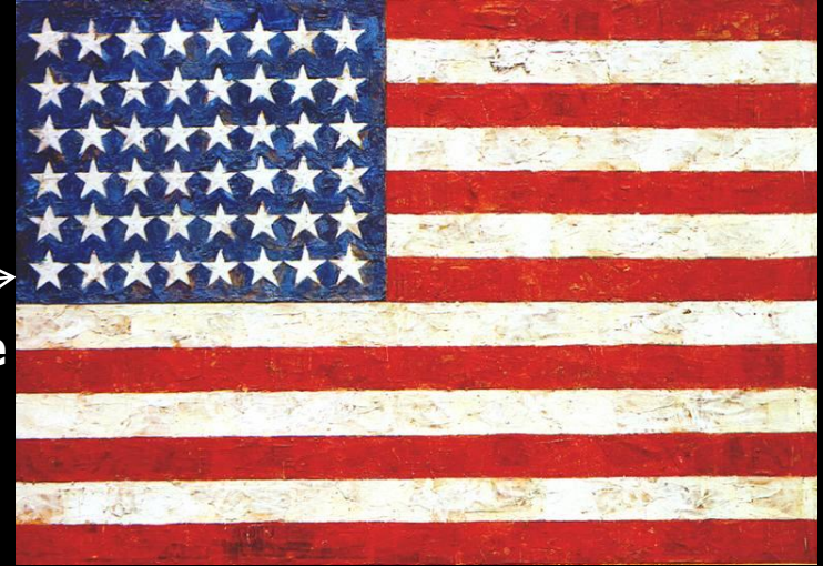
J. Johns, Flag, 1954-55, New-York