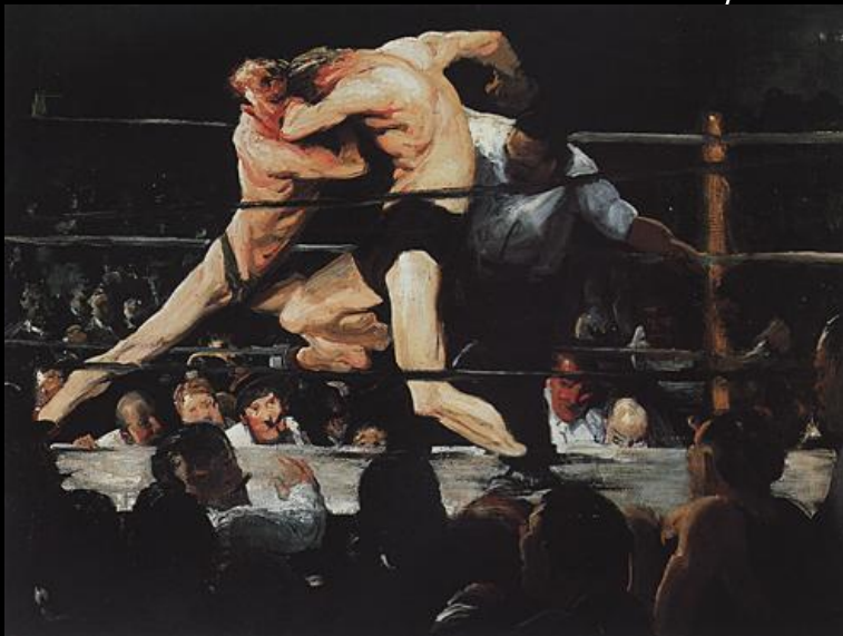
G. Bellows, Stag at Sharkey's, 1909, Cleveland