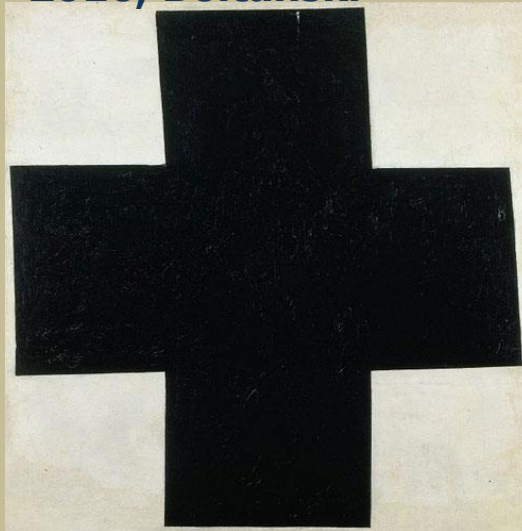
Croix (noire), 1915, Malevitch