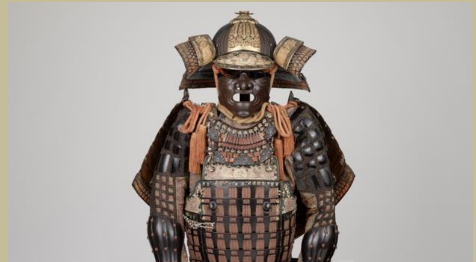
Armure samourai (Mogamido Tosei Gusoku), Japon