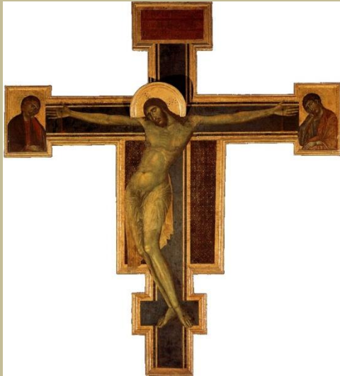
Crucifix de Santa Croce, Florence, 1272, Cimabue