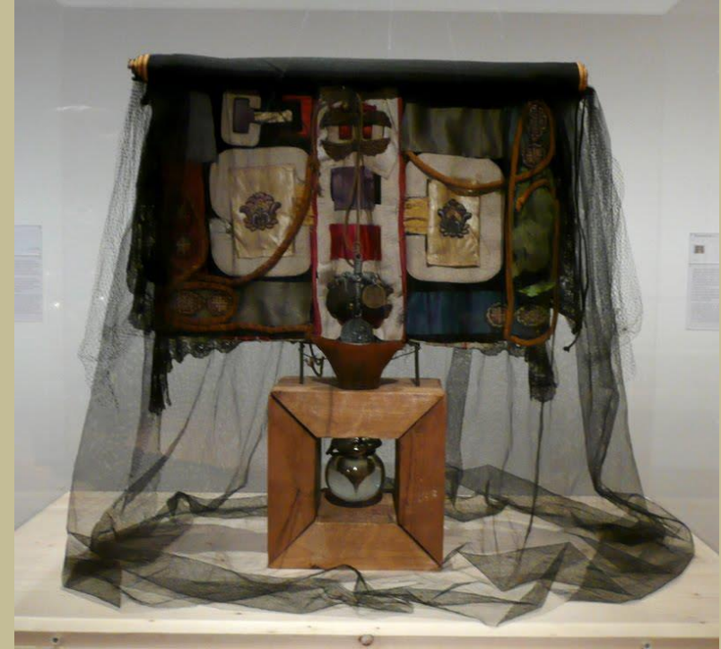
Passementerie, 1949, Etienne-Martin