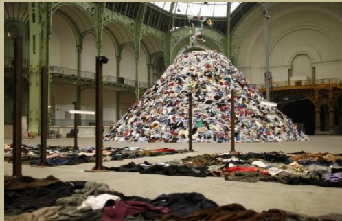
Monumenta, 2010, Boltanski