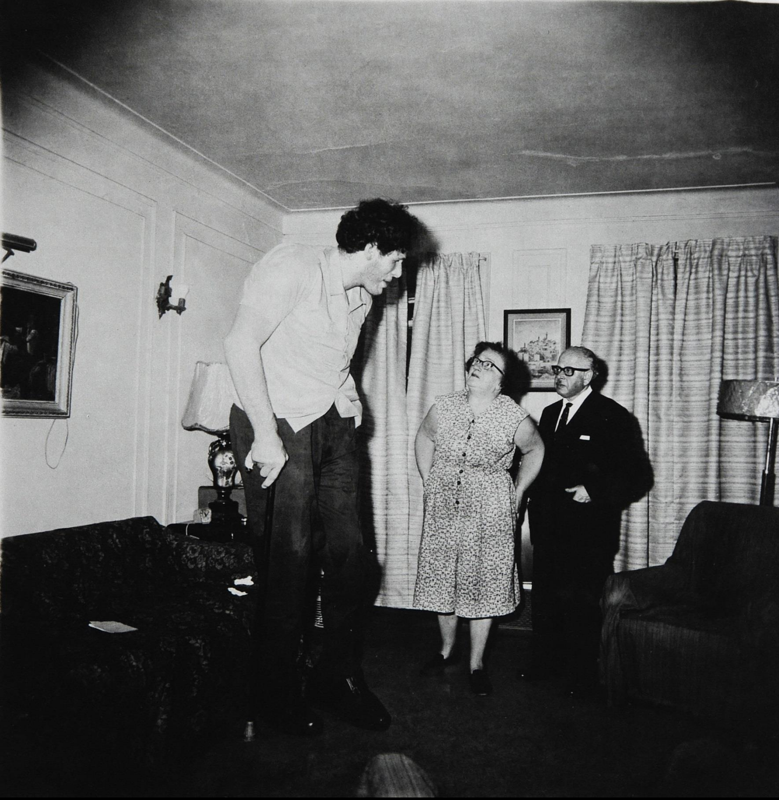
D. Arbus, A Jewish Giant at Home with His Parents in The Bronx, N.Y., 1970