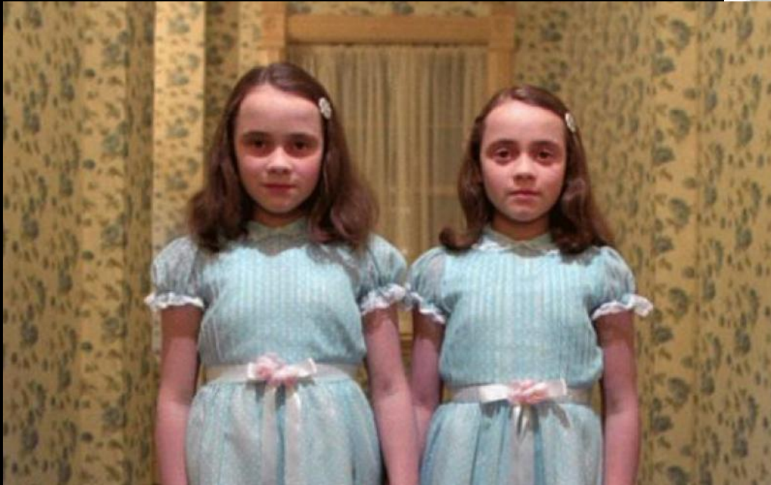
S. Kubrick, Shining (les jumelles), 1980 @