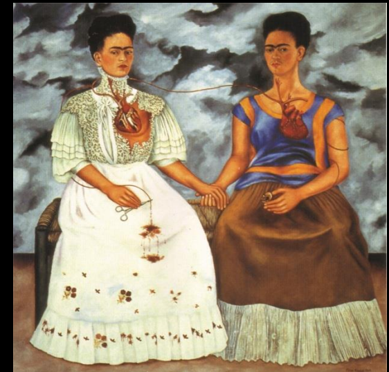
F. Kahlo, Las dos Fridas, 1939