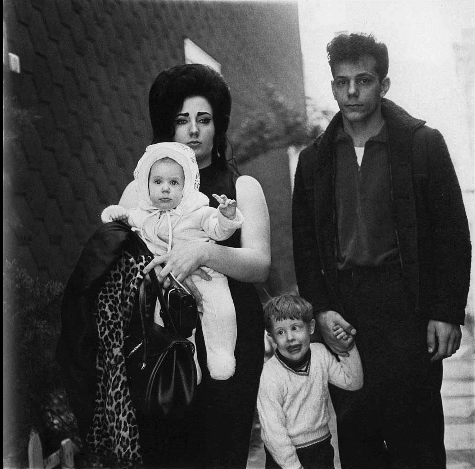
D. Arbus, A young Brooklyn family going on a Sunday outing, 1966