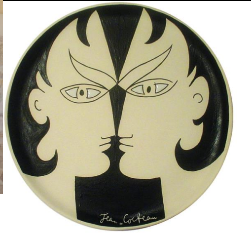
J. Cocteau, Les Dioscures, 1958