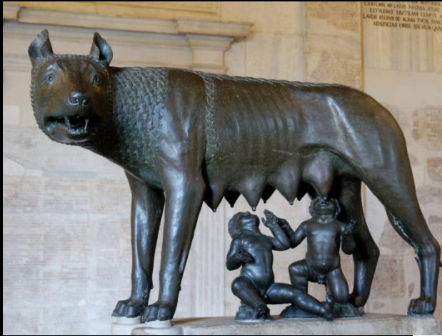
La louve du Capitole, Vème siècle av. J.C., Rome