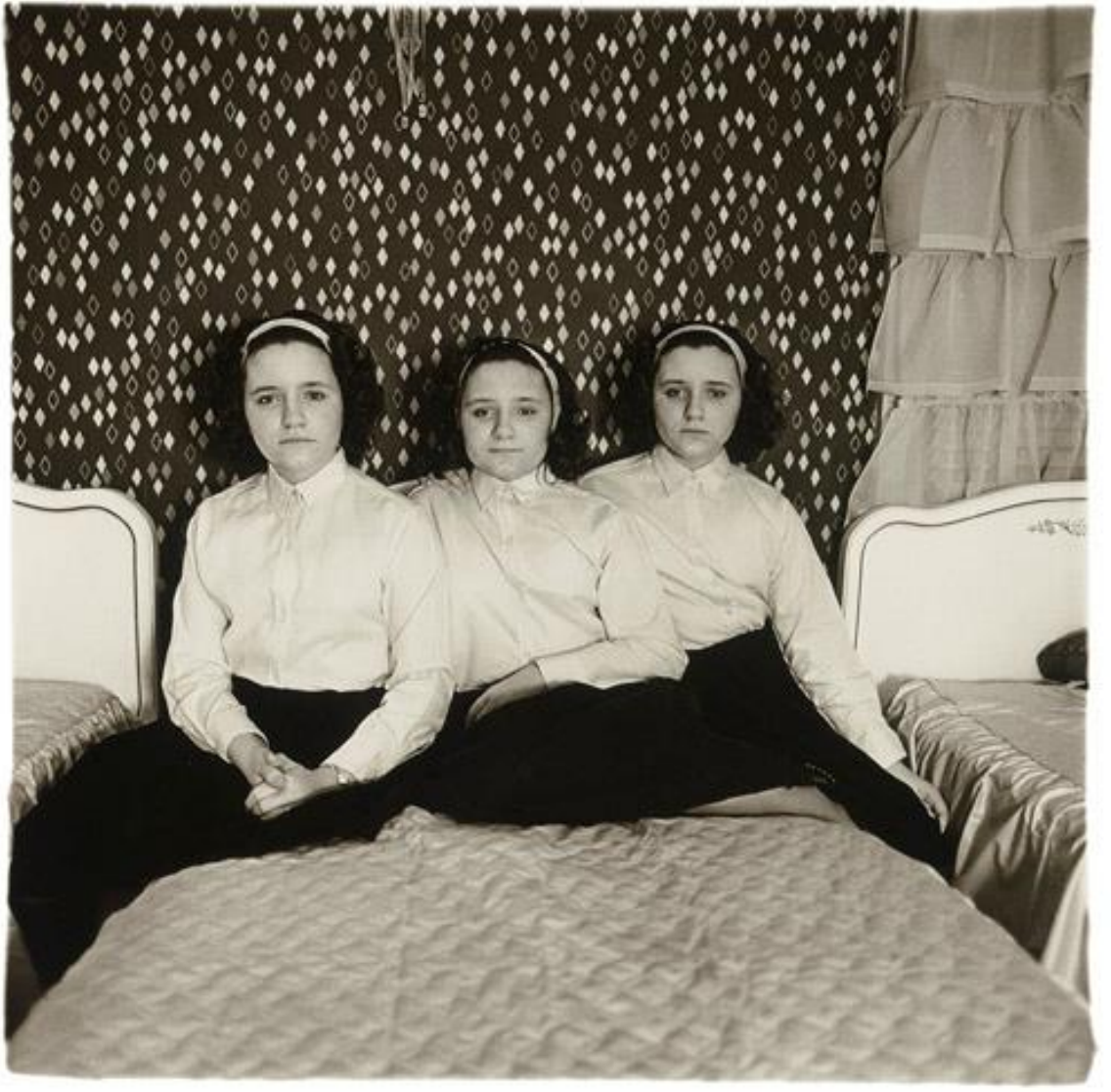
D. Arbus, Triplets in their bedroom, New jersey, 1963

Réaliser des compositions jumelles (travail autour de la symétrie)