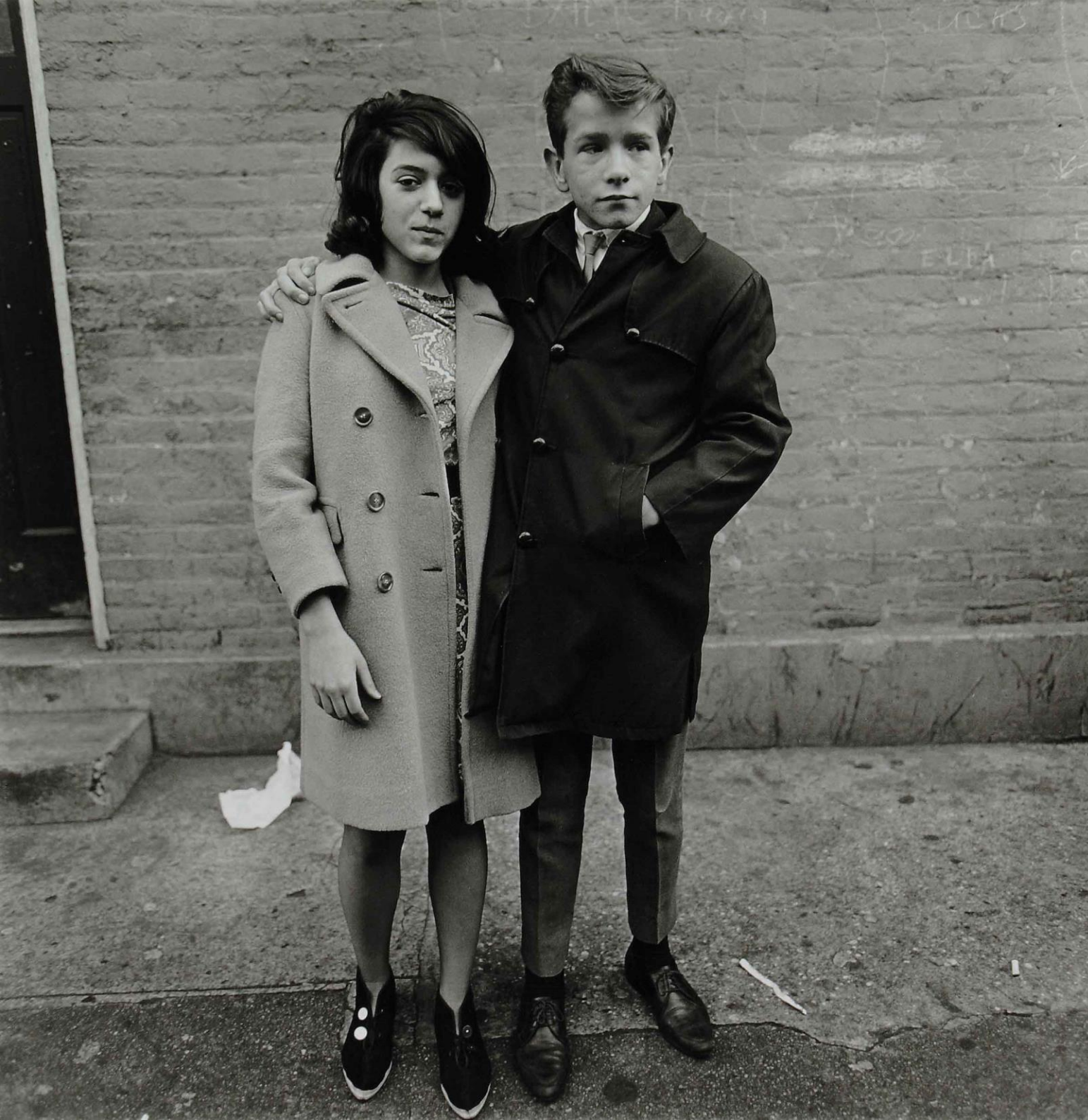
D. Arbus, Teenage Couple Hudson Street NYC, 1963