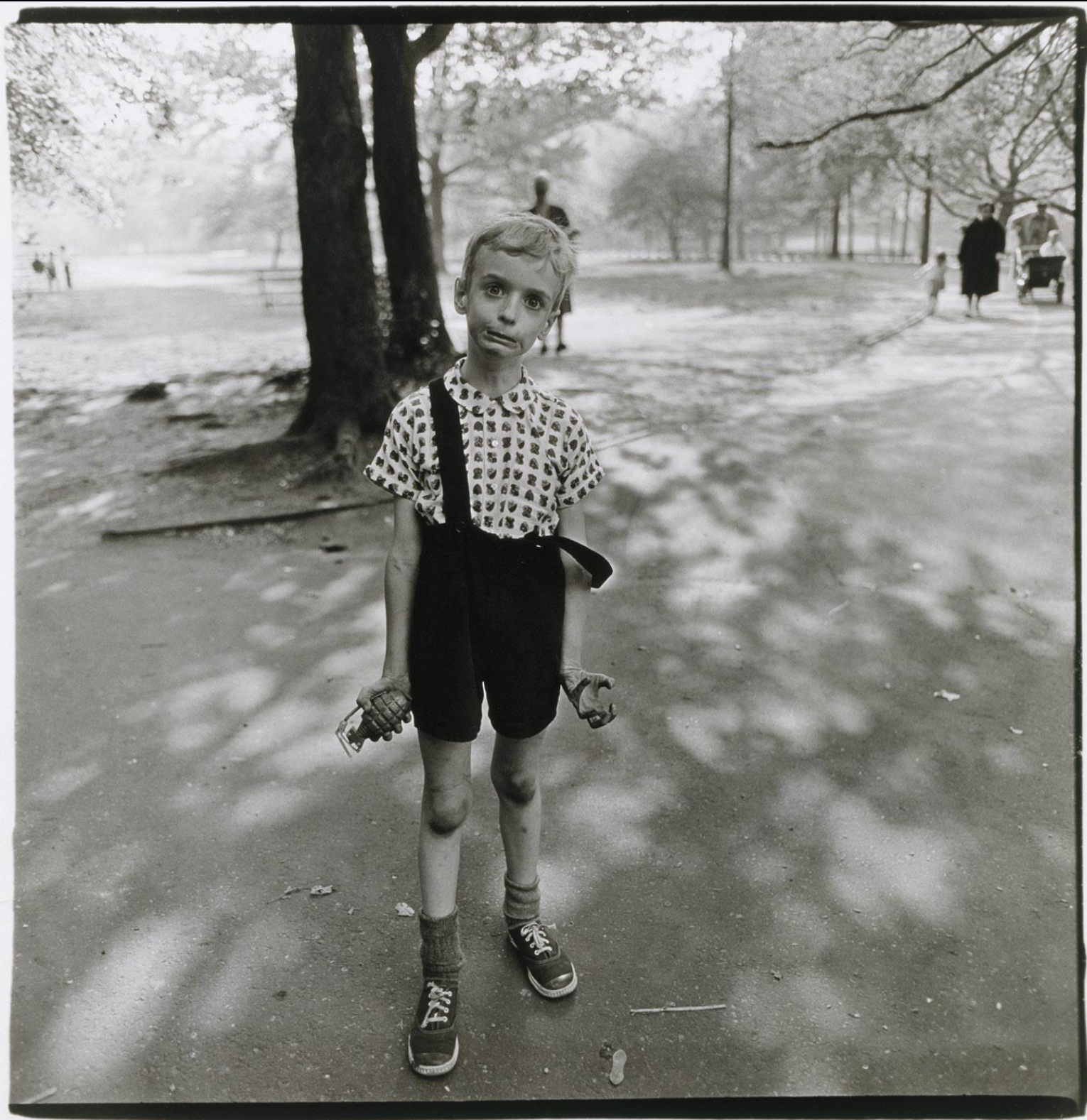
D. Arbus, Child with Toy Hand Grenade in Central Park, N.Y.C., 1962