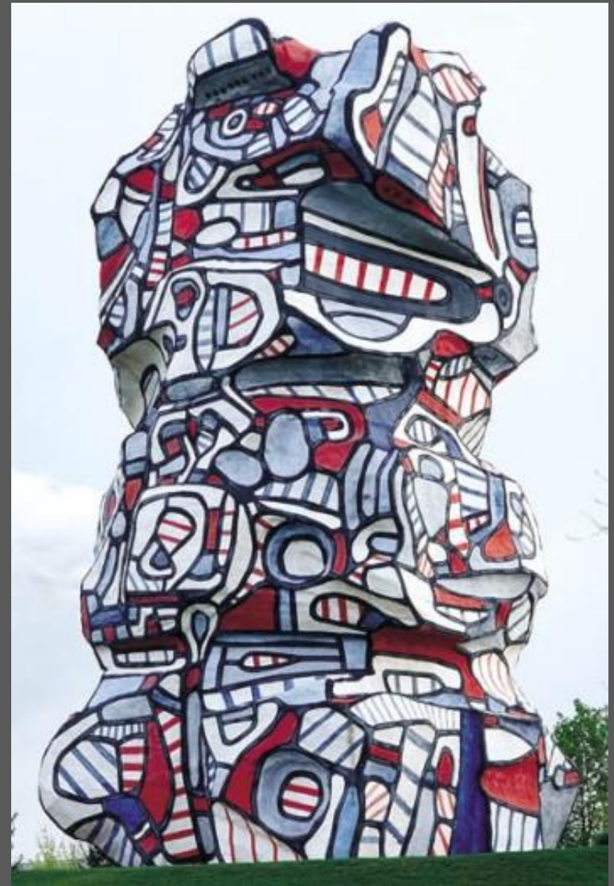
La tour aux figures, J. Dubuffet, Issy-les-Moulineaux, 1988