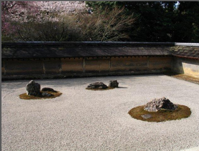
Jardin zen, RyoanJi, Kyoto