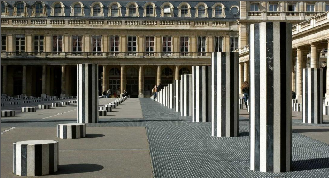
Les deux plateaux, D. Buren, 1986