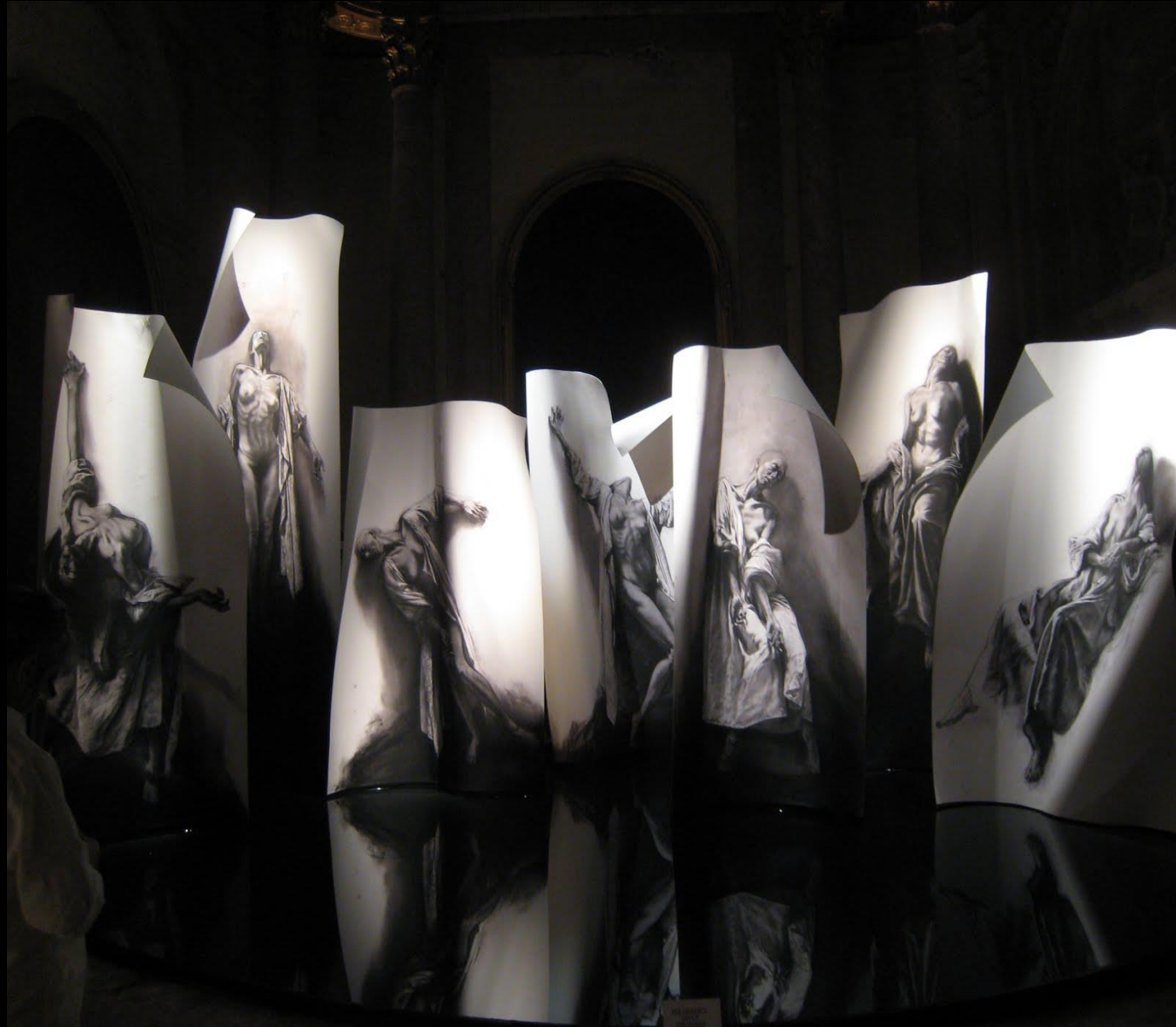
E. Pignon-Ernest, Extases, 2010

Produire une œuvre avec l'ordinateur et simuler son installation dans la ville sur la base de photographies numériques (copier/coller)