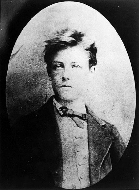
E. Carjat, Portrait d'Arthur Rimbaud, 1871