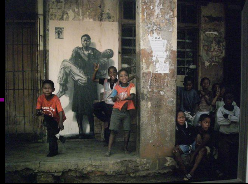
.E. Pignon-Ernest, Soweto-Warwick-Durban, Afrique du Sud. Le fléau du sida en Afrique, 2002