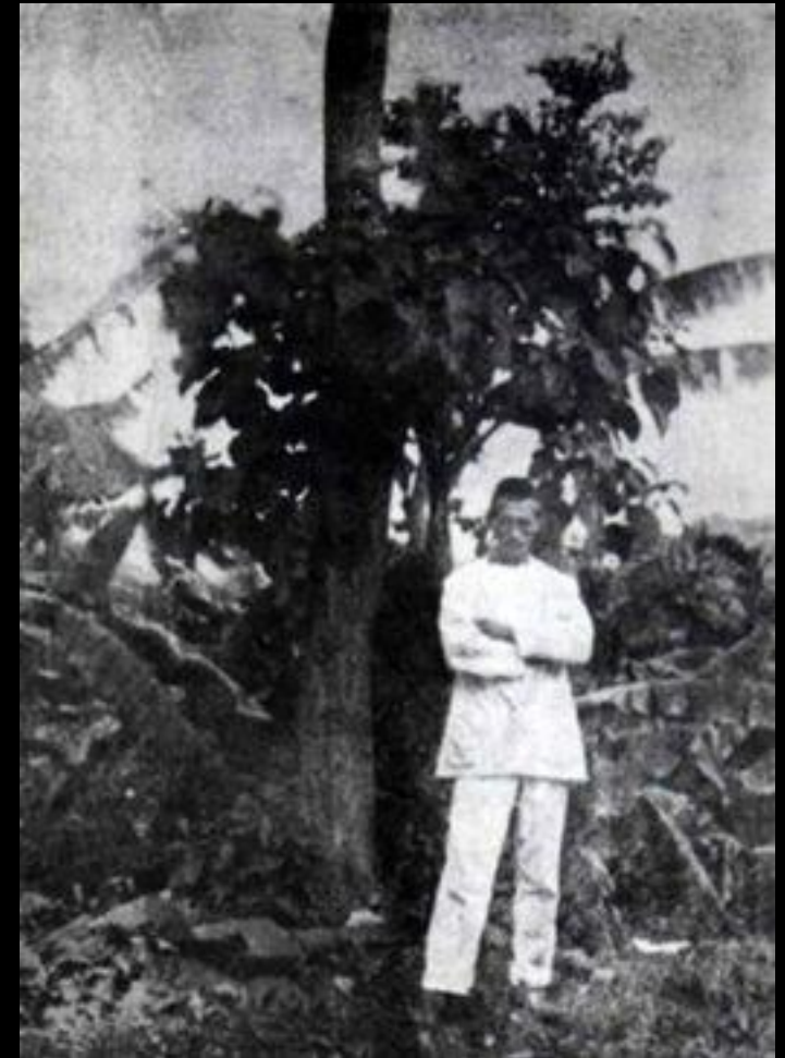
Arthur Rimbaud lors d'un de ses séjours à Harar, en Ethiopie.