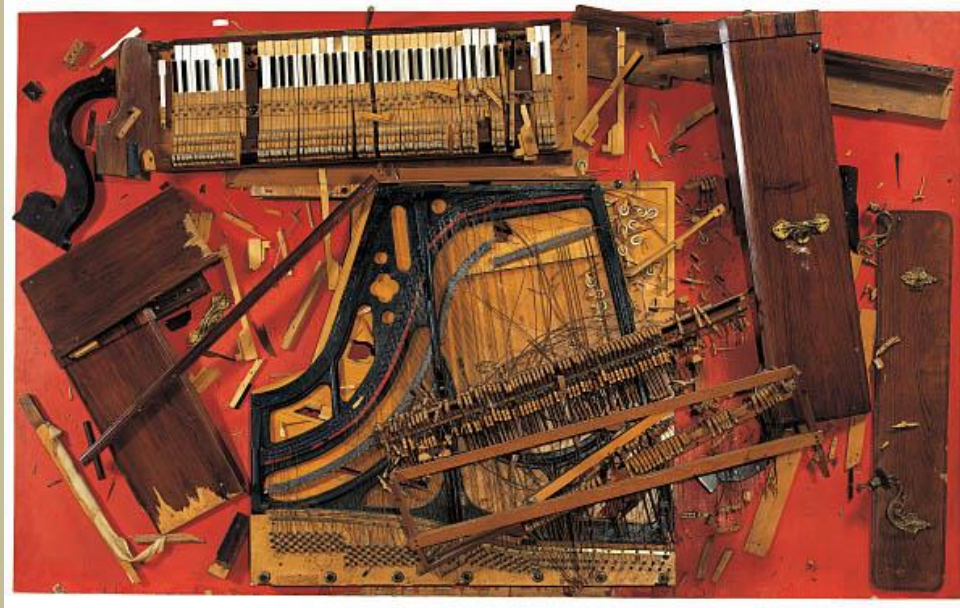
Arman, Chopin's Waterloo, 1962, Paris

Le Nouveau Réalisme pose la question du statut de l'objet dans l'œuvre d'art comme dans notre propre société