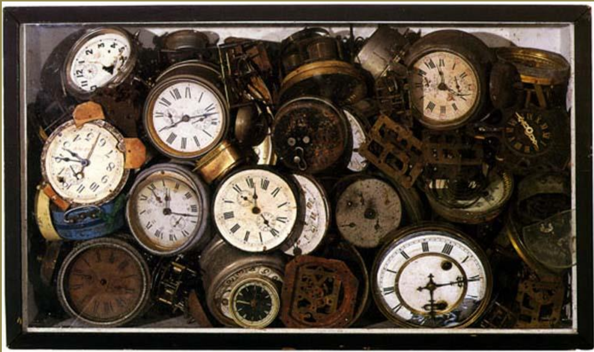
Arman, Paradoxe du temps, 1961