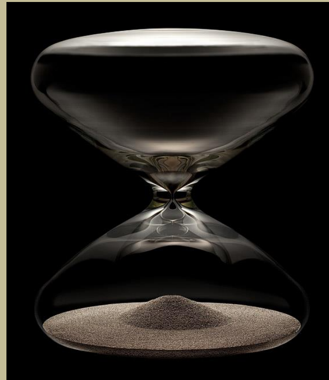
M. Newson, Hourglass HGS20, 2010