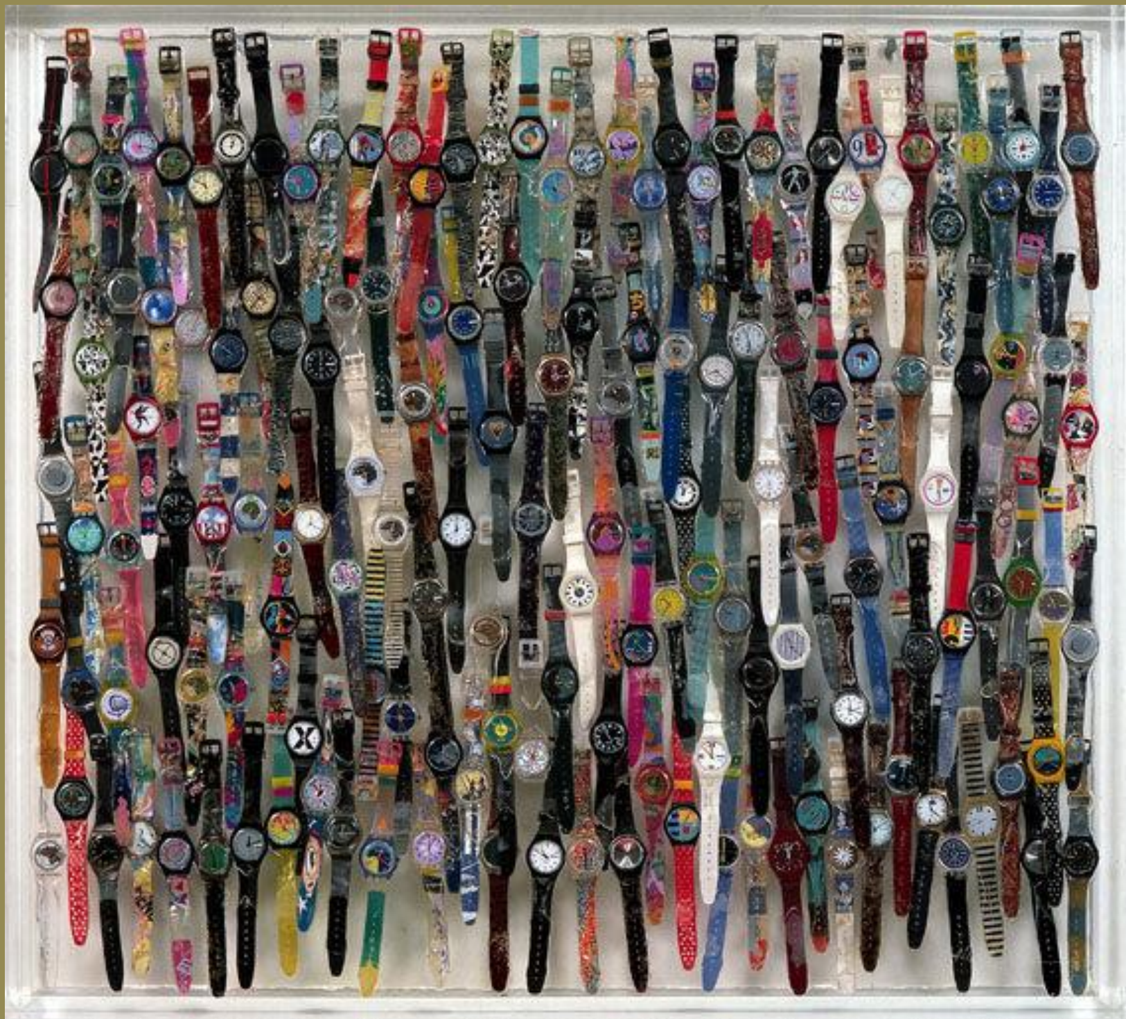
Arman, Swatchmania, 1992