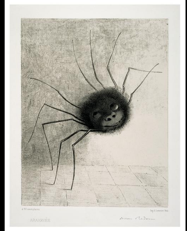
•O. Redon, L'araignée, 1894, Londres (estampe)