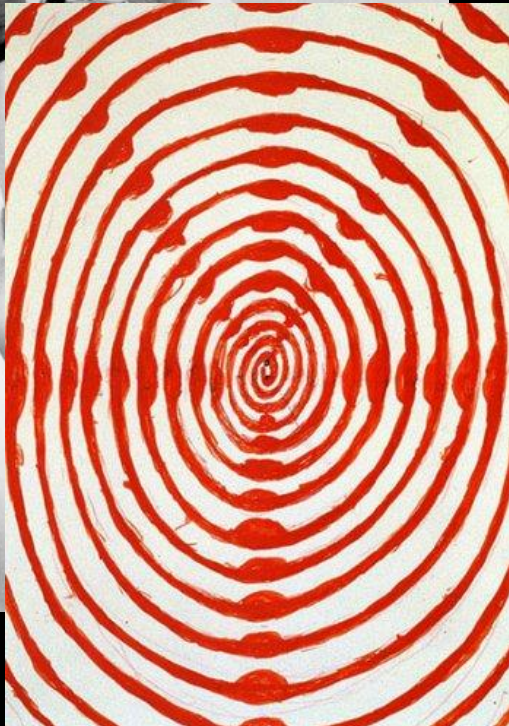
Portrait de L. Bourgeois et Spirale, 1994