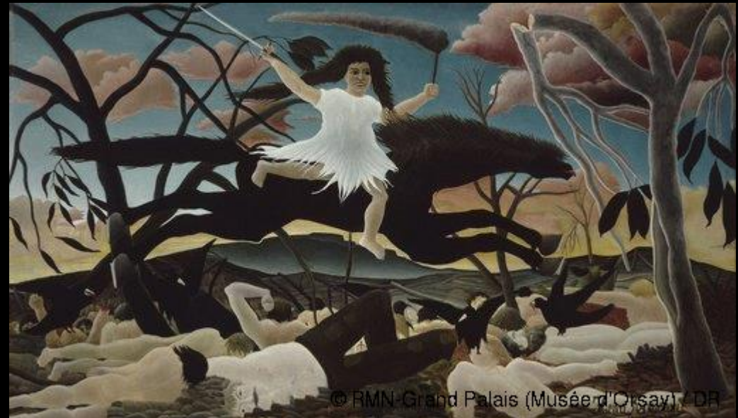
H. Rousseau dit Le Douanier, La Guerre, 1894, Paris