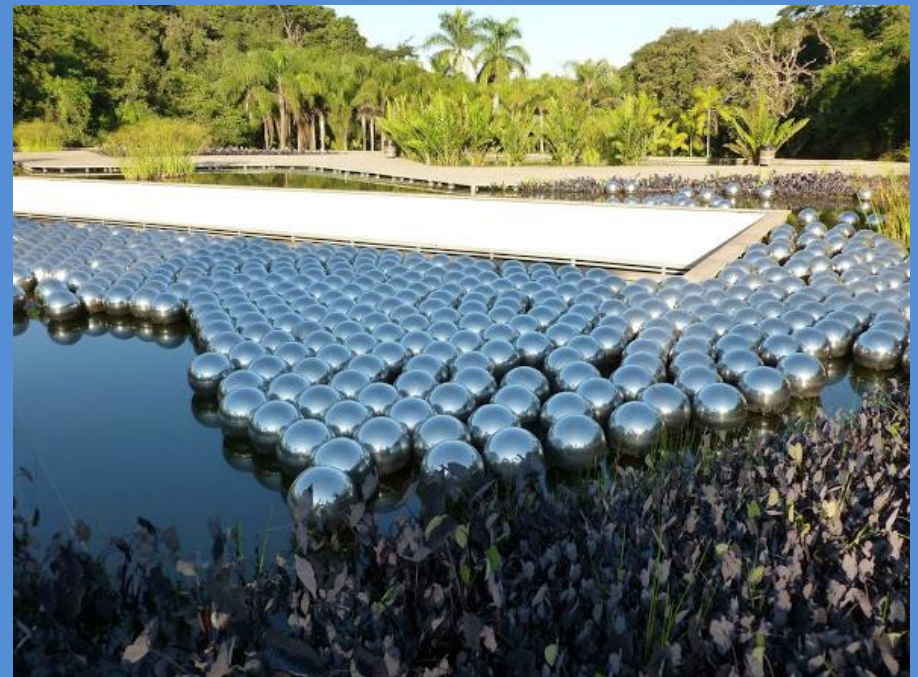
Le jardin de Narcisse, Y. Kusama, Parc Inhotim, Brésil