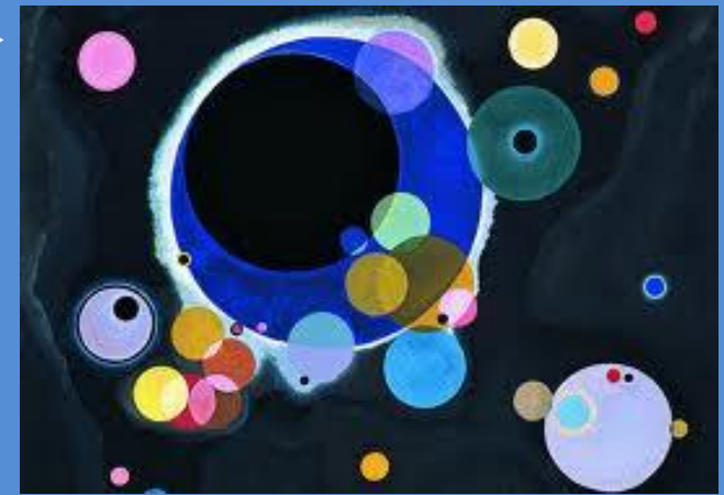
Cercles, 1926 – V. Kandinsky