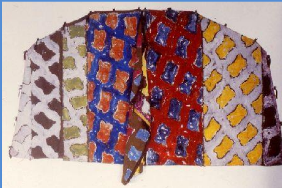
Peinture sur bâche, 1978 – C. Viallat