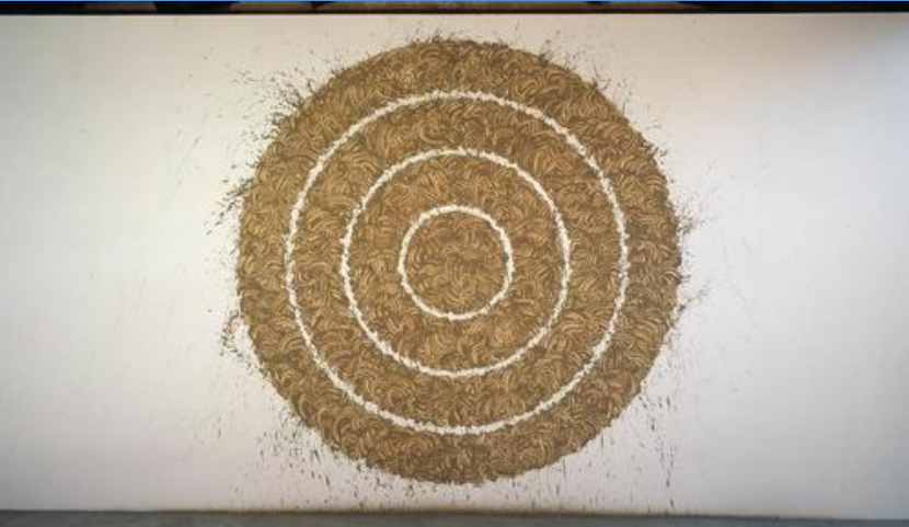
Cercles de boue de Garonne, 1990 – R. Long